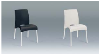
stoel kunststof wit of zwart