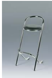
Barkruk wit of zwart verchromd