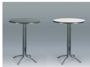
Statafel zwart of marmewit H113, Ø86,5cm