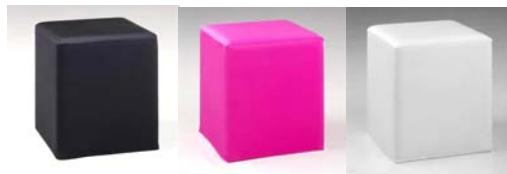
Poefje zwart, pink of wit