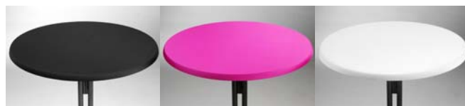
Topcover zwart, pink of wit