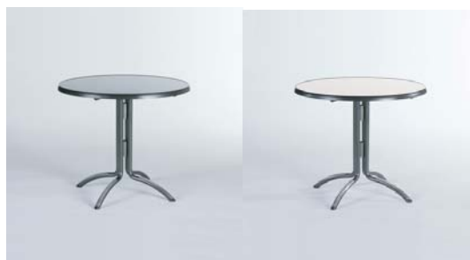
Tafel zwart of marmewit H72,5, Ø86,5cm