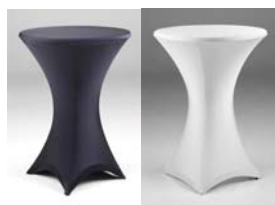
Tafel stretch inclusief topcover wit of zwart